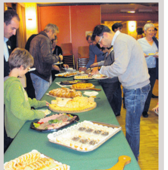
Un bon festin attendait les invités.