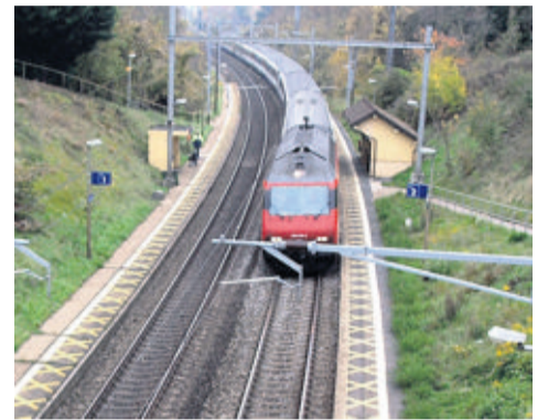
La halte de Tolochenaz ne répond plus aux normes de sécurité. Hermann

En voie de constitution, une convention passée entre la commune, le canton et les CFF, stipulera que la halte CFF de Tolochenaz sera rétablie. Mais ceux qui ont passé le cap de la cinquantaine risquent fort de vivre cet événement à titre posthume: il est tributaire de la réalisation d'une troisième voie dont la planification reste nébuleuse. Autant dire que le temporaire risque d'être long, à défaut d'être définitif. Et les conventions ont parfois bien de la peine à être respectées. A Tolochenaz, l'exemple du déplacement de la ligne de tir du Boiron en est une illustration.