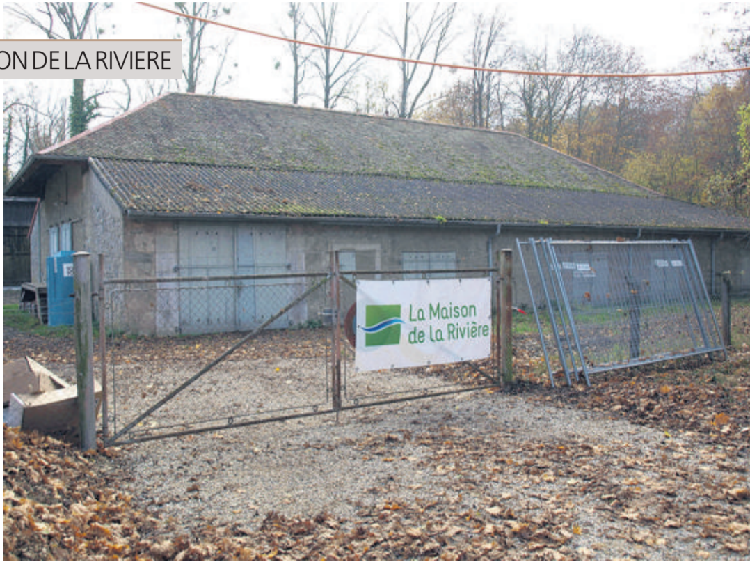
La Maison de la Rivière dans son état actuel. Hermann

Rappelons que La Maison de la Rivière, située sur la rive gauche du Boiron, à proximité de son embouchure, sur le territoire de la commune de Tolochenaz, s'articule autour d'un bâtiment qui faisait autrefois office de poudrière