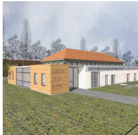
L'ancienne poudrière sera transformée en musée. Derrière prendront place des labos et des chambres pour les chercheurs et une pêcherie.