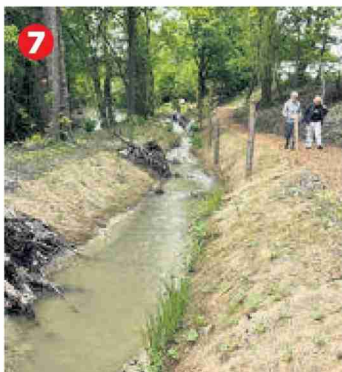
7 Un canal didactique présente les différents aménagements des berges d'une rivière.