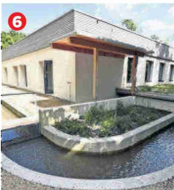
6 Le site servira de laboratoire à ciel ouvert pour les scientifiques.