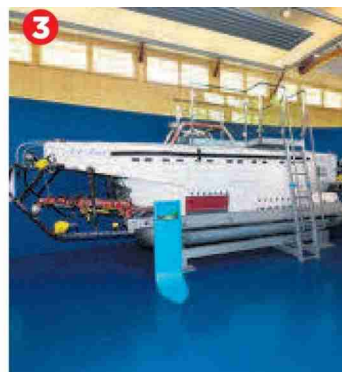
3 Le sous-marin F.-A.-Forel , construit par Jacques Piccard, clou de l'exposition.