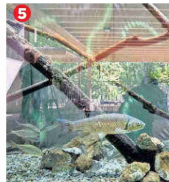
5 Les visiteurs peuvent admirer plusieurs espèces de poissons dans des aquariums.