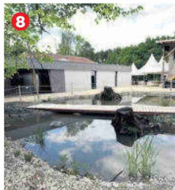
8 Deux étangs présentent la vie aquatique dans ce type de cours d'eau.