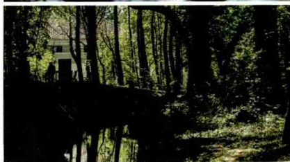
Maison de la Rivière (2)