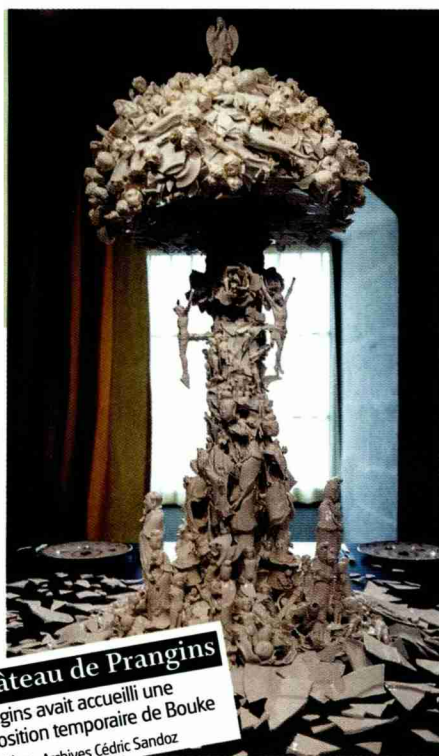
Château de Prangins Prangins avait accueilli une exposition temporaire de Bouke de Vries.