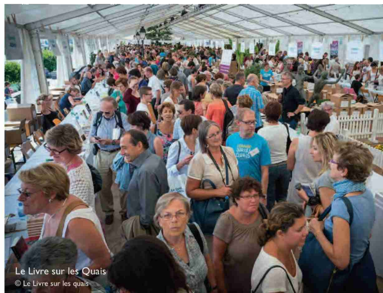
Le Livre sur les Quais

Sur les bords du plus grand lac d'Europe s'épanouissent des cépages qui font la renommée de l'appellation La Côte AOC. Grâce au Pass Wine Tasting, découvrez les spécialités locales au fil de vos haltes chez les vigneron passionnés et éveillez vos papilles lors d'une dégustation! Vous pourrez ainsi appréhender toute la richesse des vins de La Côte, la plus grande région viticole de Suisse, où la variété des sols offre une large palette de goûts. Vous pourrez également profiter des nombreux restaurants, auberges et cafés de la région proposant des plats délicieux et authentiques.