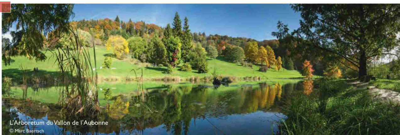
L'Arboretum du Vallon de l'Aubonne

Rue du Château 2 • CH-1110 Morges Tél. +41 21 801 32 33 • Fax +41 21 801 31 30 info@morges-tourisme.ch • www.morges-tourisme.ch