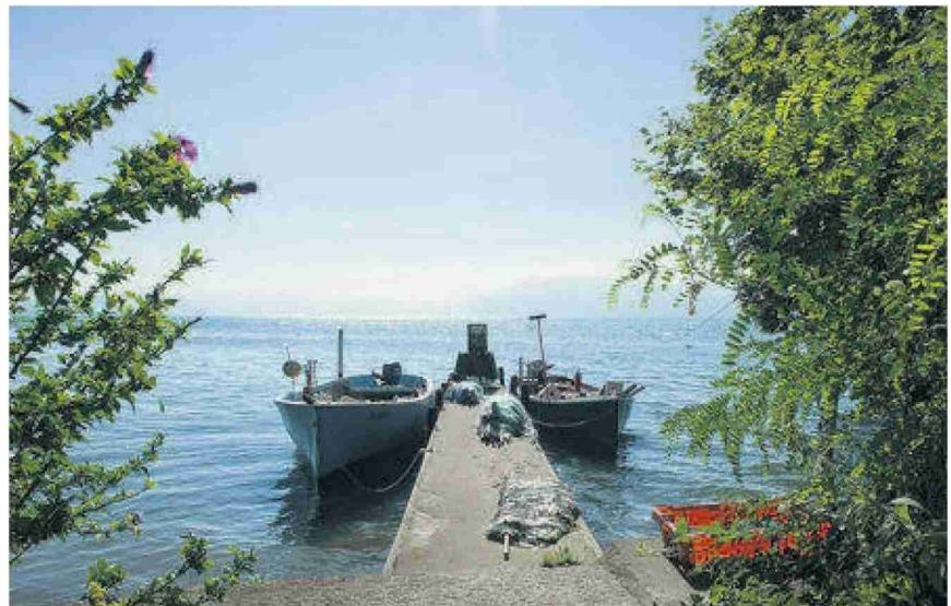
La forêt est aussi le fief des pêcheurs.

Si le nom du sentier peut laisser songeur, pas besoin d'être un ichtyologue pour apprécier les lieux. Les prétextes ne manquent pas pour oser une escapade sous les frênes, hêtres, chênes et tilleuls qui sont légion. Dans chaque recoin de la forêt se cache potentiellement une surprise. Des petites plages de sable offrent l'hospitalité aux amateurs de bronzage ou aux fans de Michael Phelps. Non loin de là, un petit marais héberge insectes et batraciens.