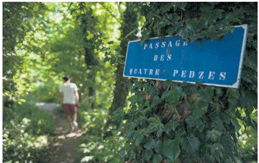
Il n'y a pas que de l'eau qui coule au Boiron.

Q uel dépaysement! A quelques pas de l'animation de la ville de Morges, le sentier de la Truite est une petite oasis de tranquillité où il fait bon flâner sous les arbres. Traversant les communes de Morges, Tolochenaz, Saint-Prex et Lully, le tracé suit les rives du lac ainsi que celles du Boiron. La balade commence du côté du port du Petit-Bois situé dans le chef-lieu du district. Mais il n'est pas obligatoire d'y débiter sa route. De multiples accès pour rejoindre les sept kilomètres du chemin pédestre existent.