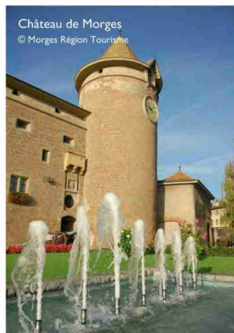
Château de Morges