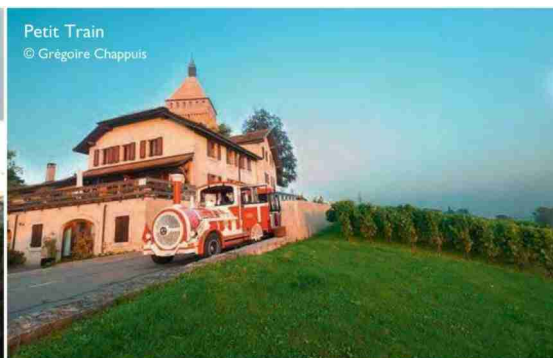
Petit Train