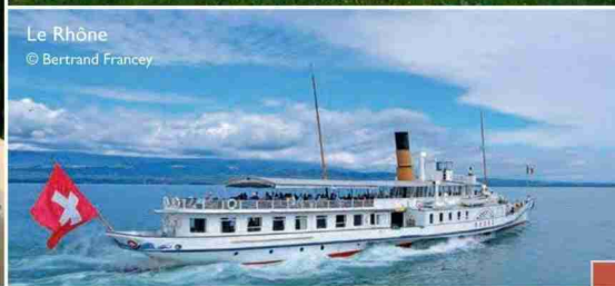
Le Rhône