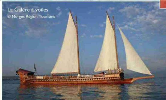
La Galère à voiles