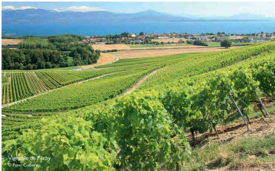
Vignoble de Féchy