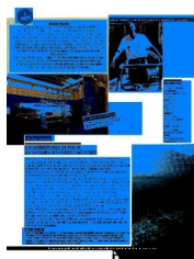
Jacques Piccard, les pieds dans son sous-marin de poche.