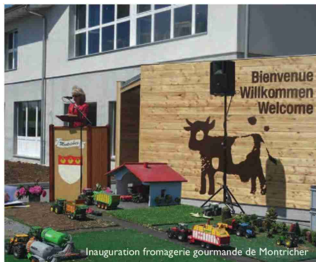
Inauguration fromagerie gourmande de Montricher