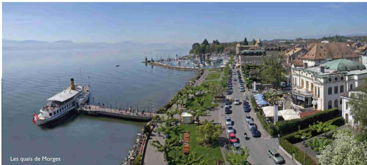
Les quais de Morges

N° de thème: 676.004 N° d'abonnement: 1096783 Page: 342 Surface: 139'961 mm 2