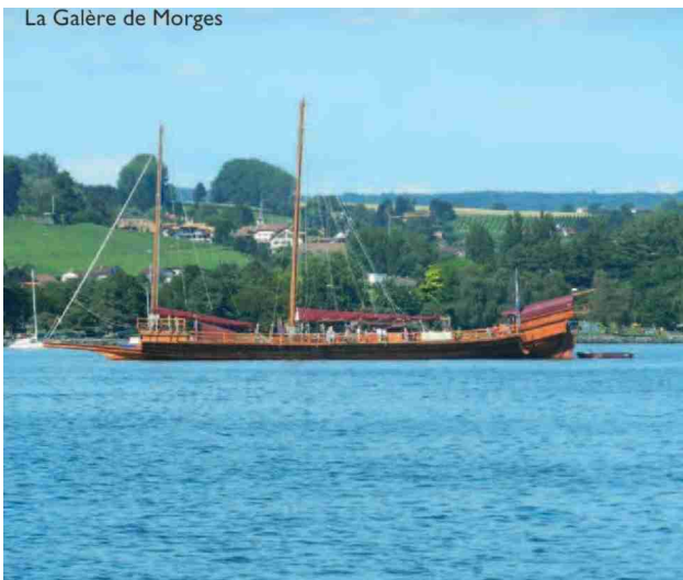
La Galère de Morges

N° de thème: 676.004 N° d'abonnement: 1096783 Page: 342 Surface: 139'961 mm 2