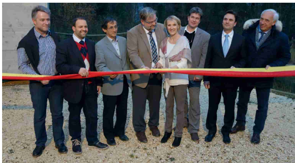
Inauguration de la Maison de la Rivière à Tolochenaz