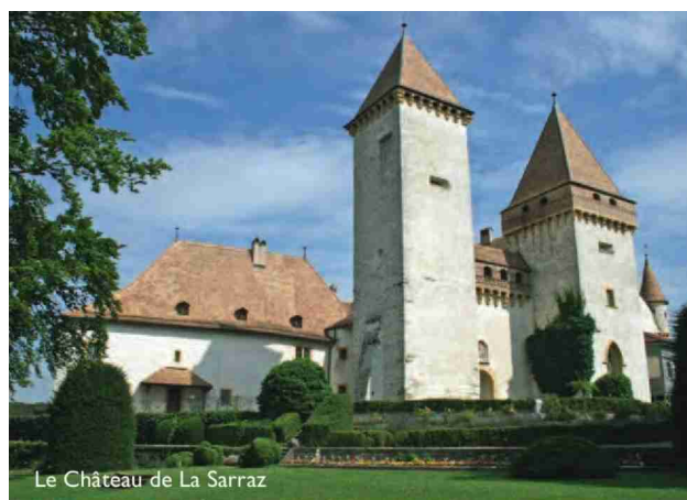
Le Château de La Sarraz

Dans le cadre du développement régional, nous soutenons actuellement le projet de construction d'un nouvel abattoir régional à Aubonne. Une structure essentielle pour répondre aux conditions-cadre de l'agriculture mais aussi assurer la qualité et la traçabilité des produits pour les consommateurs. Parmi les projets récemment réalisés, on peut citer la Maison de la Rivière à Tolochenaz. Un projet pour lequel nous nous sommes beaucoup impliqués. Il revêt plusieurs aspects intéressants pour la région en tant que centre de loisirs, musée, centre de compétences en matière de renaturation des cours d'eau (en collaboration avec l'UNIL et l'HEPIA) et futur incubateur de startups dans le domaine de la protection de l'environnement.