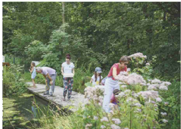
FLORE ET FAUNE De retour d'une activité pêche, une famille contemple la biodiversité présente sur le site.